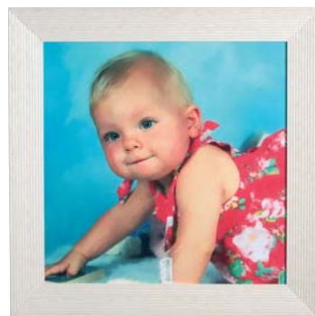
Gamme Carré d'Art