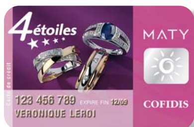
Agnès Lheureux Votre Responsable Clientèle 4 Étoiles Maty

PS. Votre carte est immédiatement utilisable : il vous suffit de la présenter en magasin ou d'indiquer son numéro lors de votre commande.